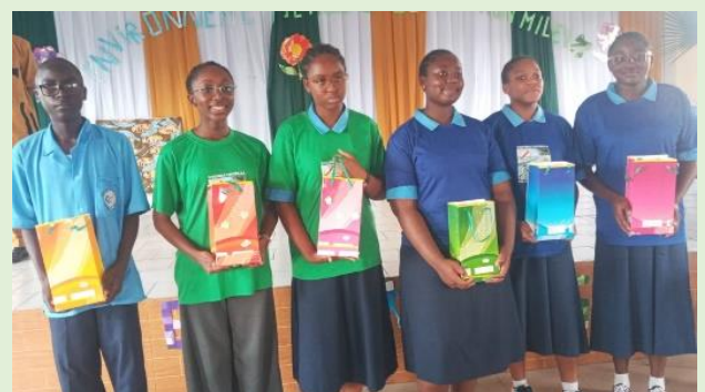
Bolsas de regalo hechas con material reciclado: las cubiertas de los cuadernos.